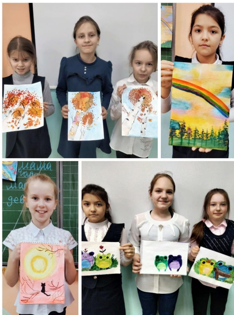
Рис.5 Творческие работы обучающихся

Практическая работа: «Проведение итогового тестирования для выявления степени усвоения теоретических знаний. Подготовка и оформление итоговой выставки. Просмотр учебных творческих работ обучающихся в форме итоговой выставки «ДарВинчи», обсуждение результатов работы». Обсуждение итогов учебного года. Награждение обучающихся. Саморефлексия. Некоторые результаты работы обучающихся можно увидеть на рисунке 5».