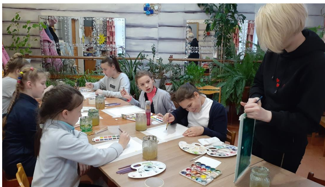
Рис.4 Выполнение пейзажа «Времена года»

Практическая работа: «Выполнение работ: пейзаж «Времена года», натюрморт их трех объектов на нейтральном фоне, портрет. На рисунке 4 можно наблюдать за исполнением одной из творческих работ».