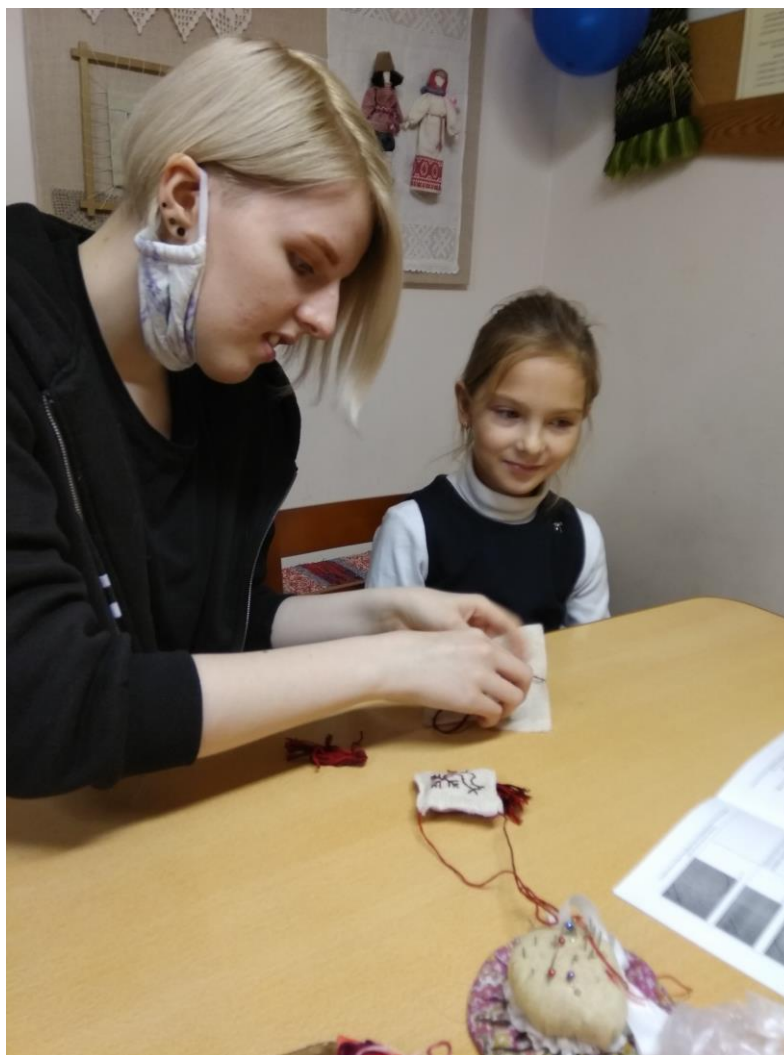
Рис.1 Выполнение изделия «Зигугу»

выбирает шов), изделие «Зигугу». Процесс выполнения изделия можно видеть на рисунке 1».