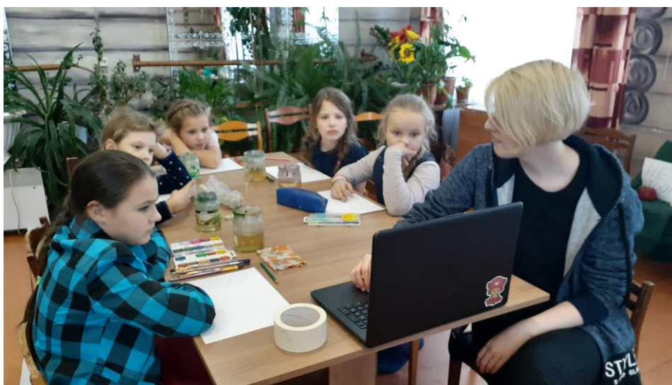
Рис.3 Ознакомление с теорией цвета и правилами построения композиции